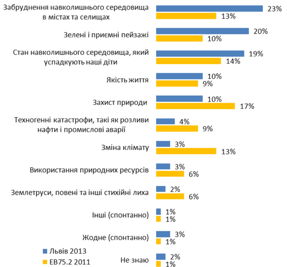
Діаграма 2. Коли люди говорять про навколишнє середовище, про що Ви думаєте в першу чергу? (1 відповідь)

Тим не менше, думки не співпадають щодо самого визначення навколишнього середовища. Якщо для 23% львів'ян – це забруднення навколишнього середовища у містах та селах, а для 20% - зелені пейзажі, то для 17% європейців – це захист природи і