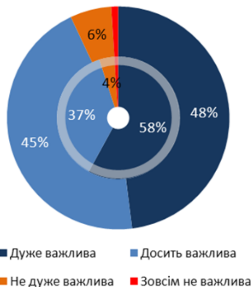
Діаграма 1. Наскільки важливою є охорона навколишнього середовища для Вас особисто?

В середині : ЕВ75. 2 2011 Ззовні : Львів 2013