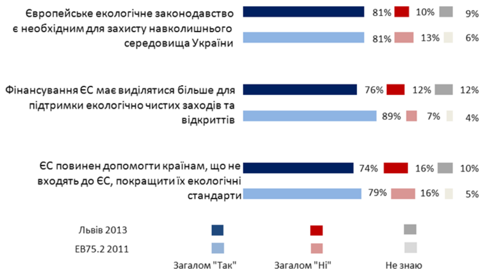
Діаграма 4. Скажіть, будь ласка, чи Ви згодні з кожним з наступних тверджень:

Беззаперечною є підтримка львів'янами введення в Україні європейських стандартів щодо охорони довкілля. 81% респондентів погоджуються, що європейське екологічне законодавство є необхідним для захисту навколишнього середовища. Найбільшу підтримку така позиція знайшла у молоді 15-24 років. Значна частка мешкан-