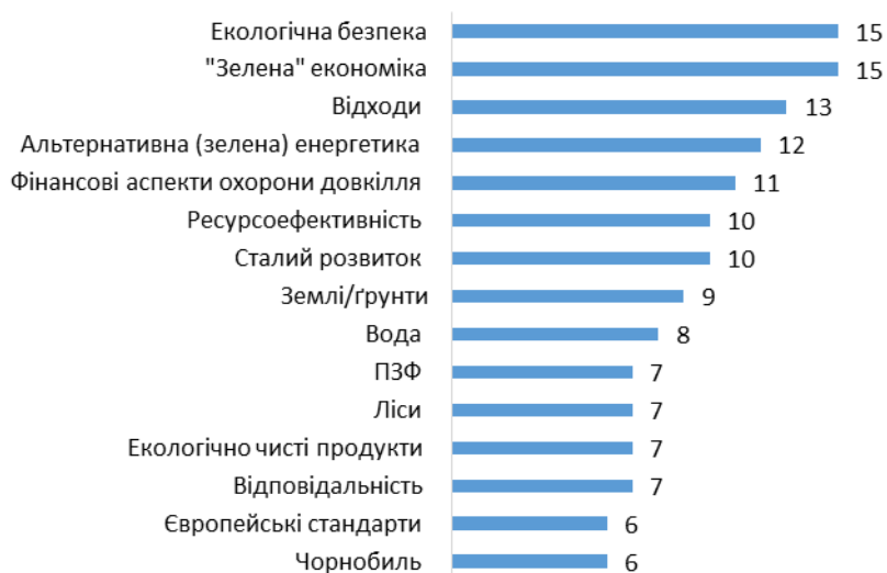
Діаграма 2. Питання охорони довкілля у програмах політичних партій, що беруть участь у місцевих виборах в Україні у 2015 році

Питання міжнародного співробітництва, виконання міжнародних угод у сфері охорони довкілля, адаптації до законодавства ЄС, виконання Угоди про асоціацію між Україною та ЄС, запровадження європейських стандартів, вирішення транскордонних екологічних проблем – теж є серед пріоритетів низки політичних партій.