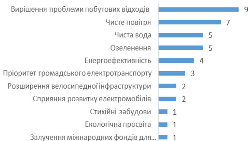
Діаграма 2. Найпопулярніші питання охорони довкілля у передвиборних програмах (кампаніях) кандидатів на міського голову міста Львова

Що стосується особистого бачення екологічної проблематики окремими кандидатами, то можна помітити загальну тенденцію щодо бачення екологічних питань в контексті проблем міської інфраструктури, рідше – екологічної якості життя, проте не як окремого самостійного комплексу питань, що стосуються виключно охорони довкілля як такого.