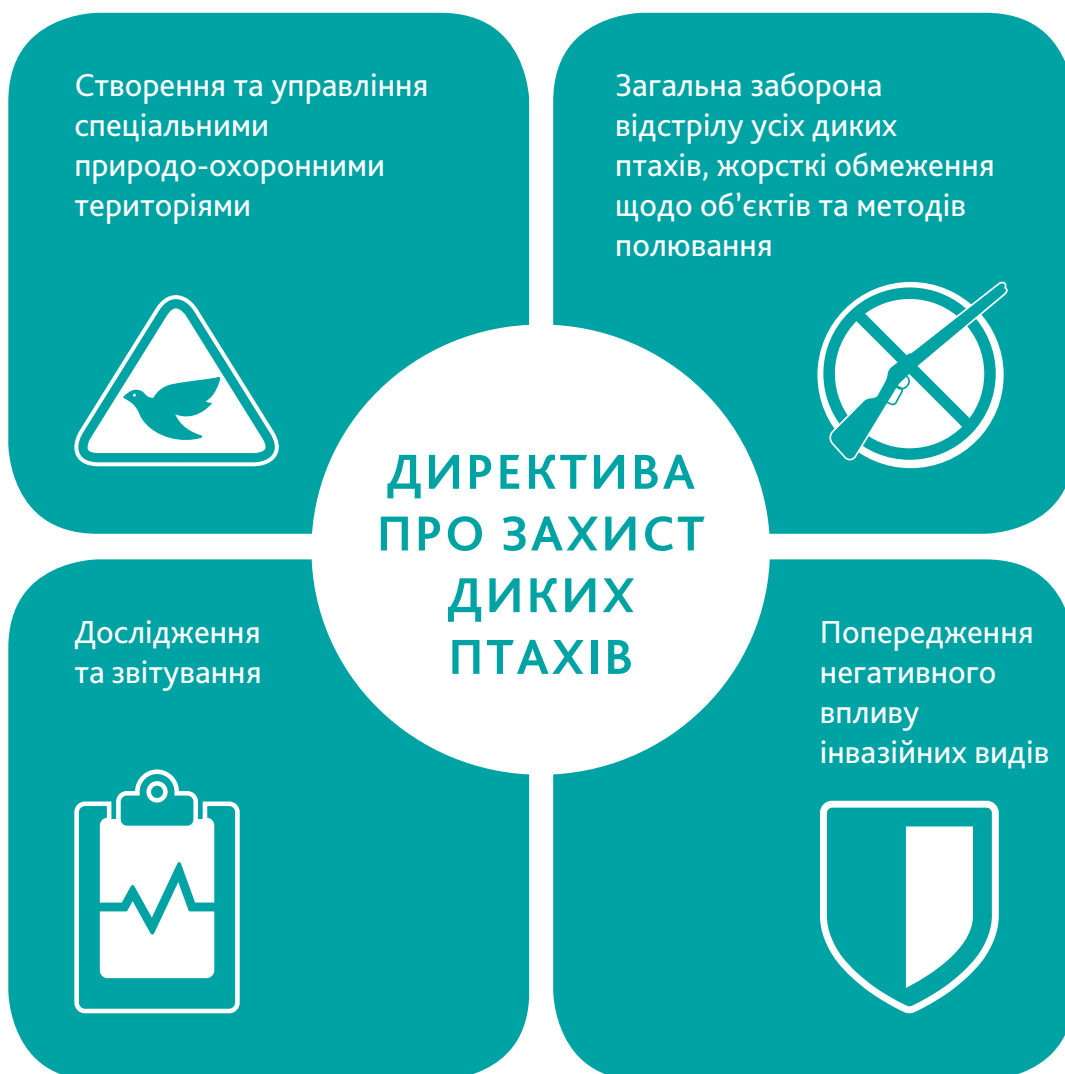
Діаграма 1. Механізм захисту птахів за Директивою (основні елементи)

Перші два елементи вимагають найбільше політичних зусиль, інституційних та економічних ресурсів для їх реалізації, тому їх варто розкрити детальніше.