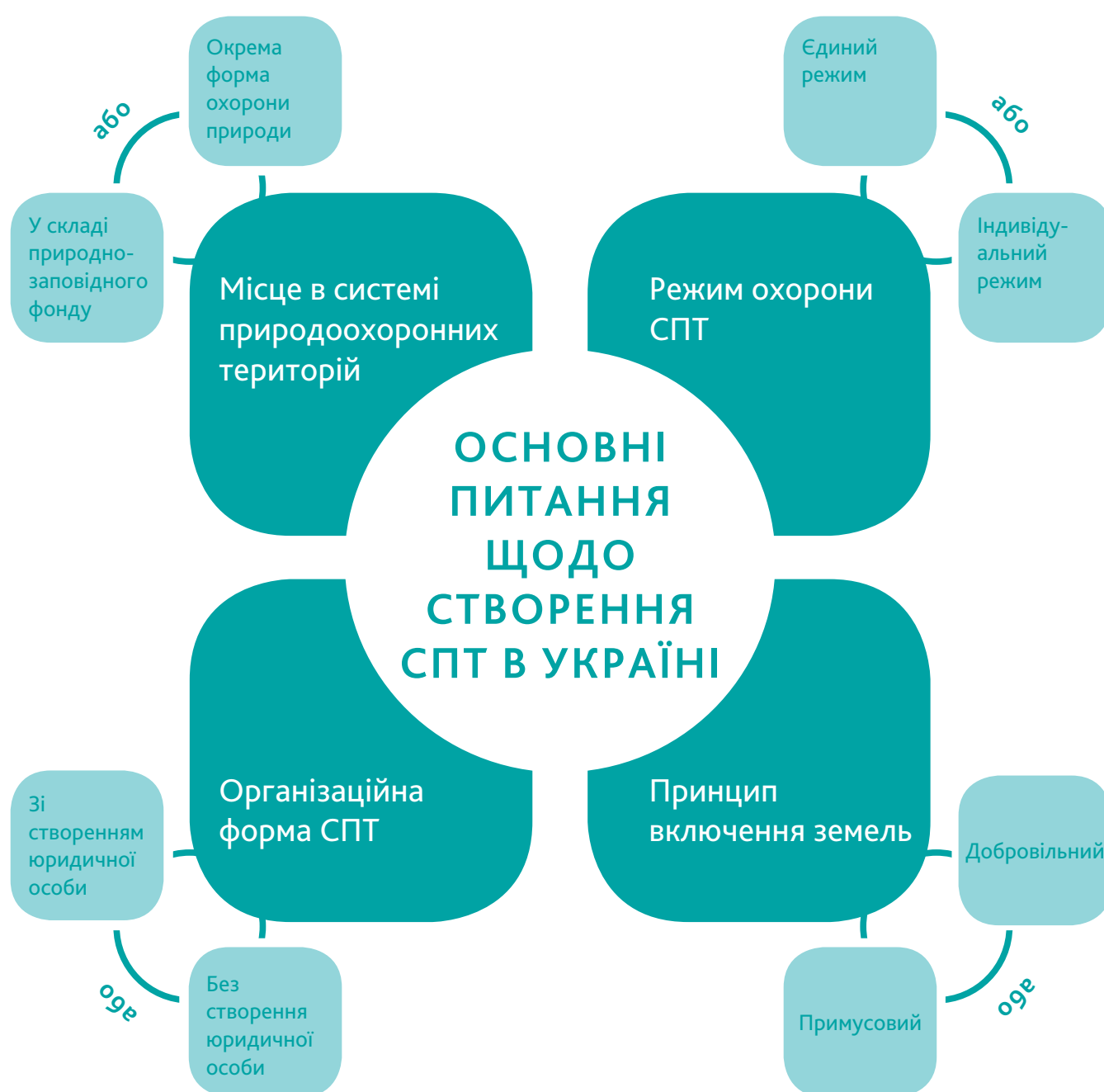
Діаграма 2. Основні питання щодо створення СПТ в Україні

Очевидним є те, що в Україні мають бути створені СПТ як самостійна форма охорони середовищ існування диких птахів на підставі та для цілей Директиви. Створення нових природоохоронних територій в Україні потребує вирішення кількох концептуальних завдань: організаційно-правової форми, підстав визначення та процедури створення, режиму охорони.