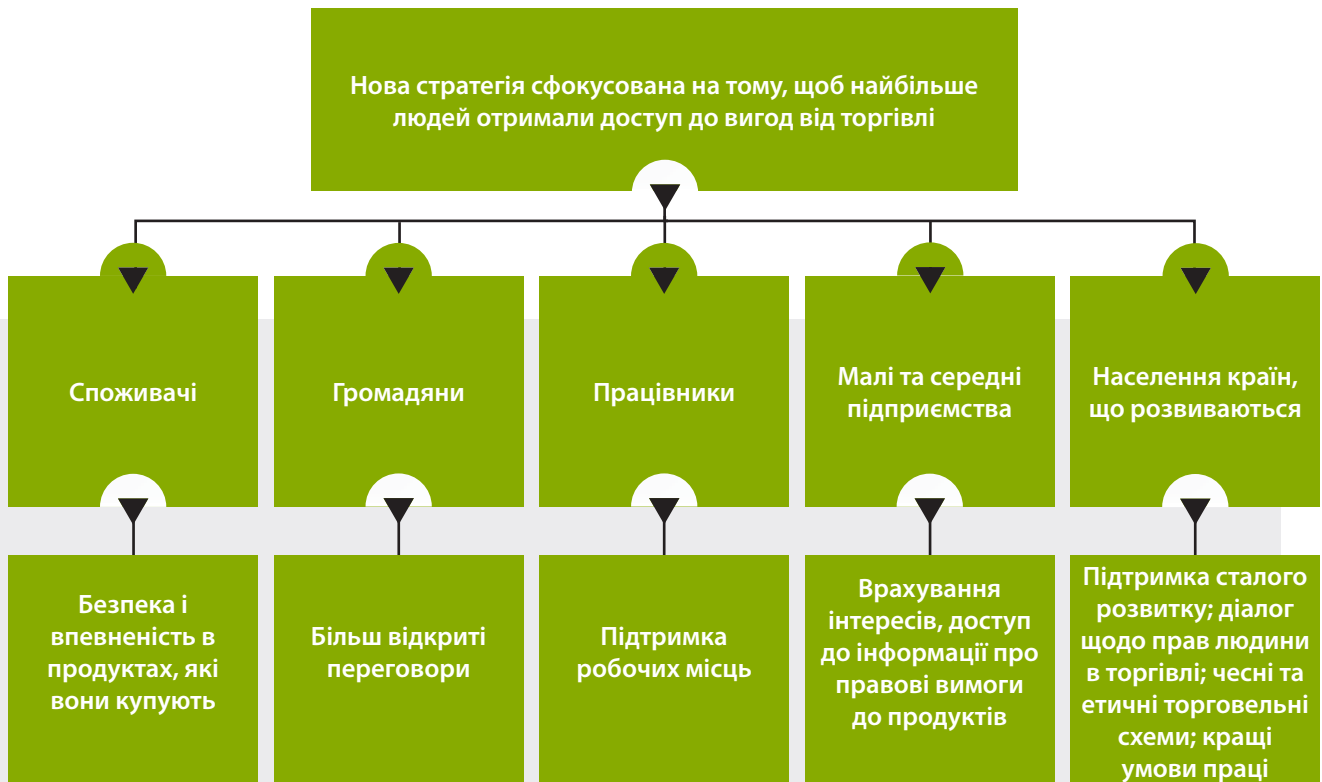
СХЕМА 1. ВИГОДИ ДЛЯ РІЗНИХ СТЕЙКХОЛДЕРІВ ВІД НОВОЇ ТОРГОВЕЛЬНОЇ ПОЛІТИКИ

угод, Європейська Комісія проводить оцінку впливу на сталість, що дає глибокий аналіз потенційного економічного, соціального та екологічного впливу.