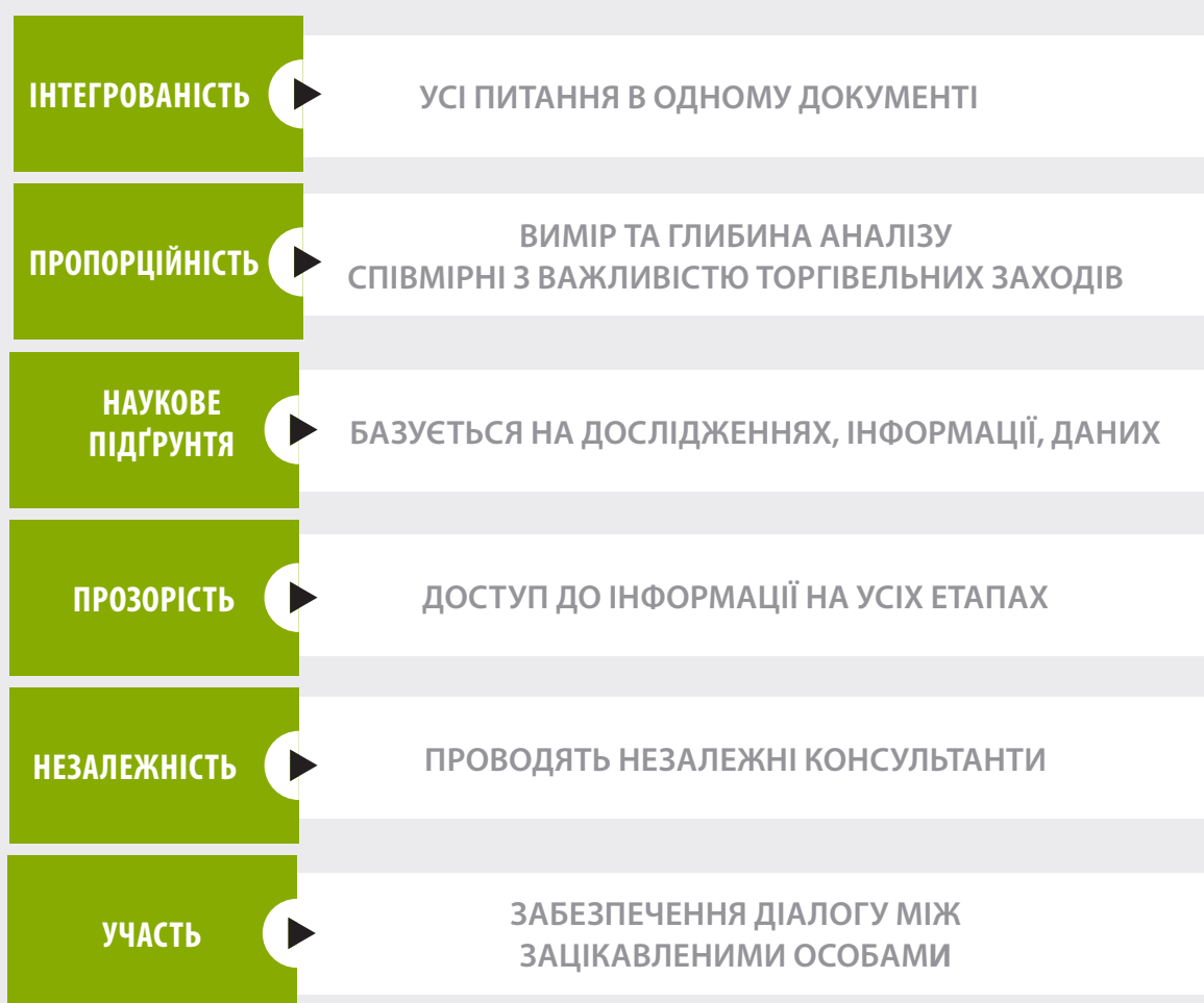
СХЕМА 2. ОСНОВНІ ПРИНЦИПИ ОВС